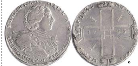
Малый крест, на груди "орел" Small cross, "eagle" on chest