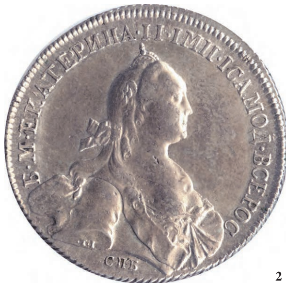
«Климовский» портрет 1768-70, 75 гг.