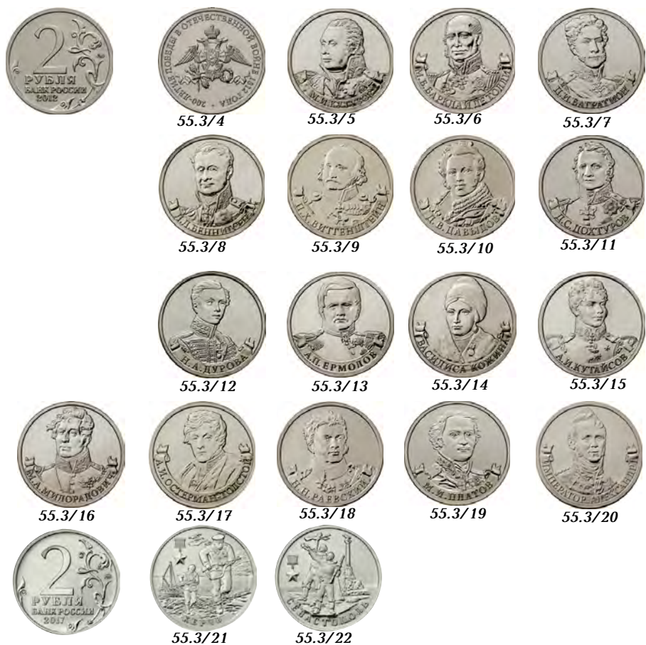
55.3/4 55.3/5 55.3/6 55.3/7 55.3/8 55.3/9 55.3/10 55.3/11 55.3/12 55.3/13 55.3/14 55.3/15 55.3/16 55.3/17 55.3/18 55.3/19 55.3/20 55.3/21 55.3/22